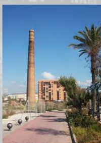
UNIÓN ESPAÑOLA DE EXPLOSIVOS